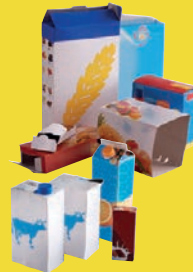
Briques et cartonnettes