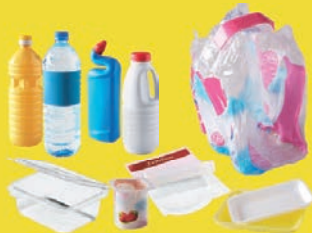
Emballages en plastique