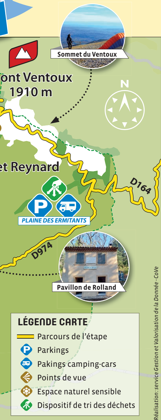
Réalisation : service Gestion et Valorisation de la Donnée - CoVe