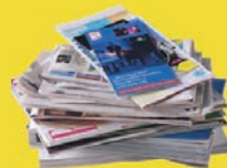
Papiers, journaux, et magazines

En vrac sans les emboîter Inutile de les laver, il suffit de bien les vider.