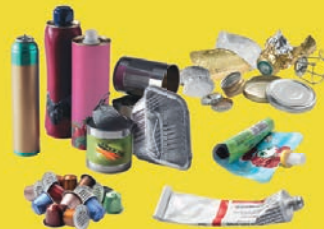
Emballages en métal